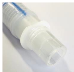
Finns med IGS (Integrerad Gas Sampling)