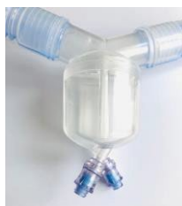
Finns med integrerad vattenfälla för både insp/exp