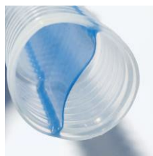
Delad innervägg (Septum)