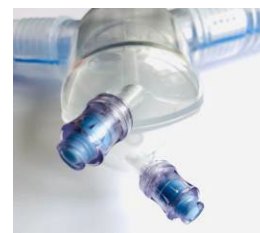
Dubbla Halkey- Roberts ventiler för att tömma vattenfällorna